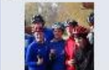
Categorie: Emelose Atb-tocht 10-11-2011